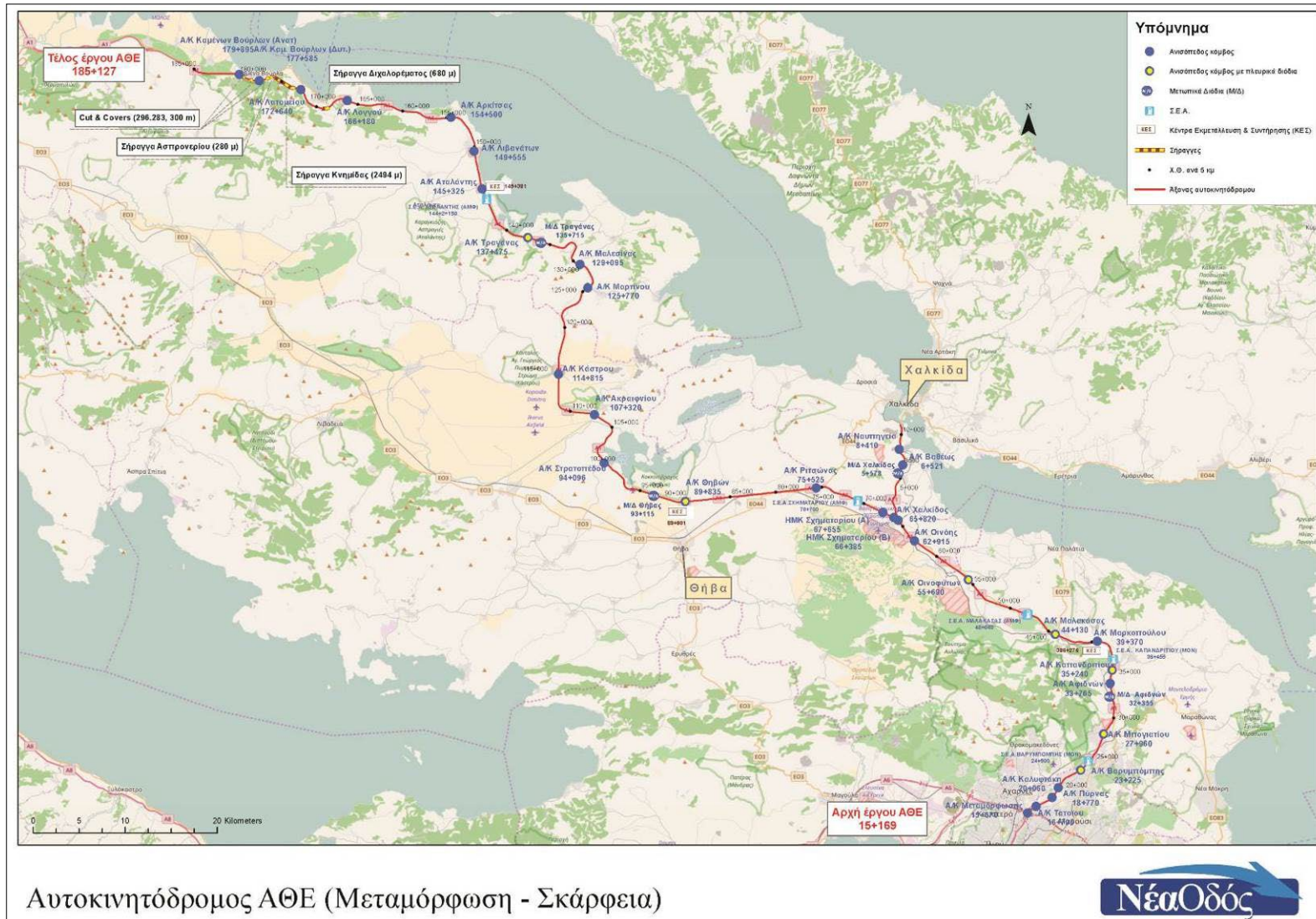
Αυτοκινητόδρομος ΑΘΕ (Μεταμόρφωση - Σκάρφεια)